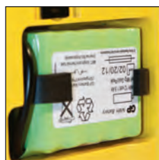
Batería de Ni/MH recargable reemplazable en el sitio