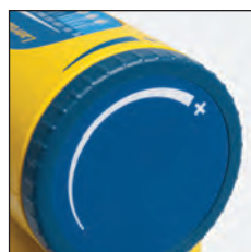
Regulador de vacío variable (50 - 550 mmHg)