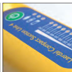
Las características del panel de control incluyen: Botón de encendido / apagado, indicador de alimentación externa, indicador de batería baja, y visor de regulador LED